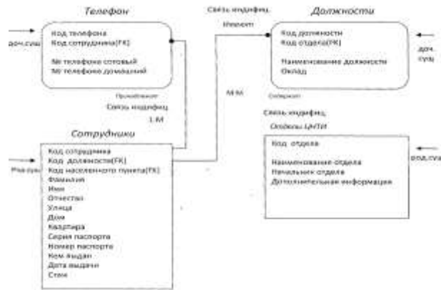
Рисунок 2 – Структура логической модели БД «Сотрудники»