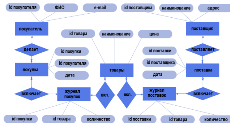
Рисунок 1 – Пример концептуальной модели предметной области «Продажи товаров»

Доставка разных товаров может производиться способами, различными по цене и скорости. Нужно хранить информацию о том, какими способами может осуществляться доставка каждого товара, и о том, какой вид доставки (а соответственно, и какую стоимость доставки) выбрал клиент при заключении сделки.