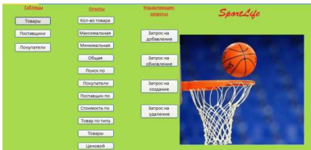
Рисунок 1 – Пользовательский интерфейс приложения

Словесное описание назначения всех элементов формы