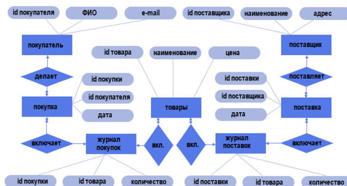
Рисунок 1 – Концептуальная модель предметной области «Продажи товаров»

Доставка разных товаров может производиться способами, различными по цене и скорости. Нужно хранить информацию о том, какими способами может осуществляться доставка каждого товара, и о том, какой вид доставки (а соответственно, и какую стоимость доставки) выбрал клиент при заключении сделки.