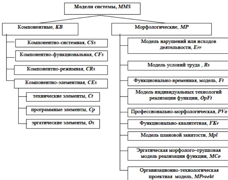
Рис. 2. Подход к определению информационных потребностей оператора-руководителя