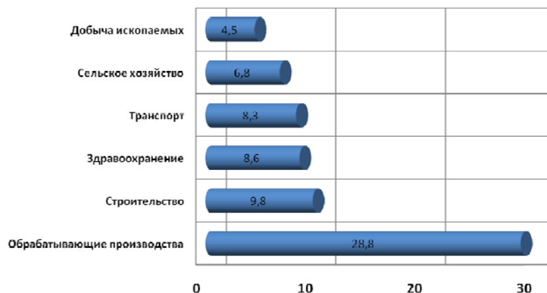
Рис. 1. Анализ состояния производственного травматизма в разрезе основных видов экономической деятельности (%)

События последних лет, связанные с трагедиями на угольных шахтах и карьерах, в строительной отрасли (рис. 2) подтверждают сложность сложившейся ситуации. Кроме того, все вышеуказанное наносит значительный материальный ущерб, так по данным Минтруда и соцзащиты РФ экономические потери, связанные с состоянием условий труда в Российской Федерации, только в 2014 г. составили около 1,29 трлн. р. или почти 2% ВВП.