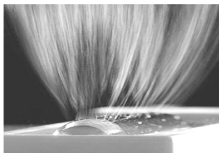
Рис. 3. Нановолокна, полученные методом электроформования