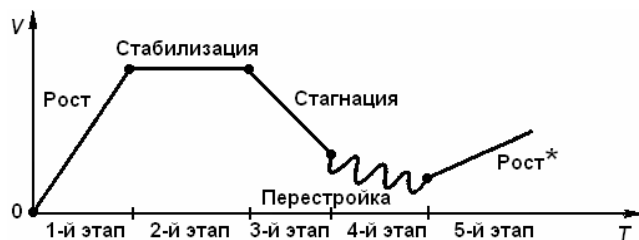
Рис. 1 Жизненный цикл промышленной фирмы (организации)