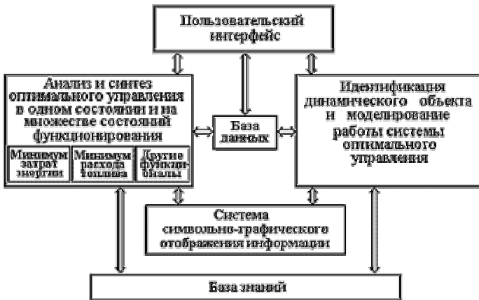
Рис. 1. Структура экспертной системы

На кафедре «КРЭМС» разработана экспертная система энергосберегающего управления (ЭС). Структура ЭС представлена на рисунке 1.