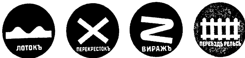
Рис. 4. Первые международные дорожные знаки (1909 г.)

После второй мировой войны в 1947 г. была создана Европейская Экономическая комиссия Организации Объединённых Наций (ЕЭК ООН),