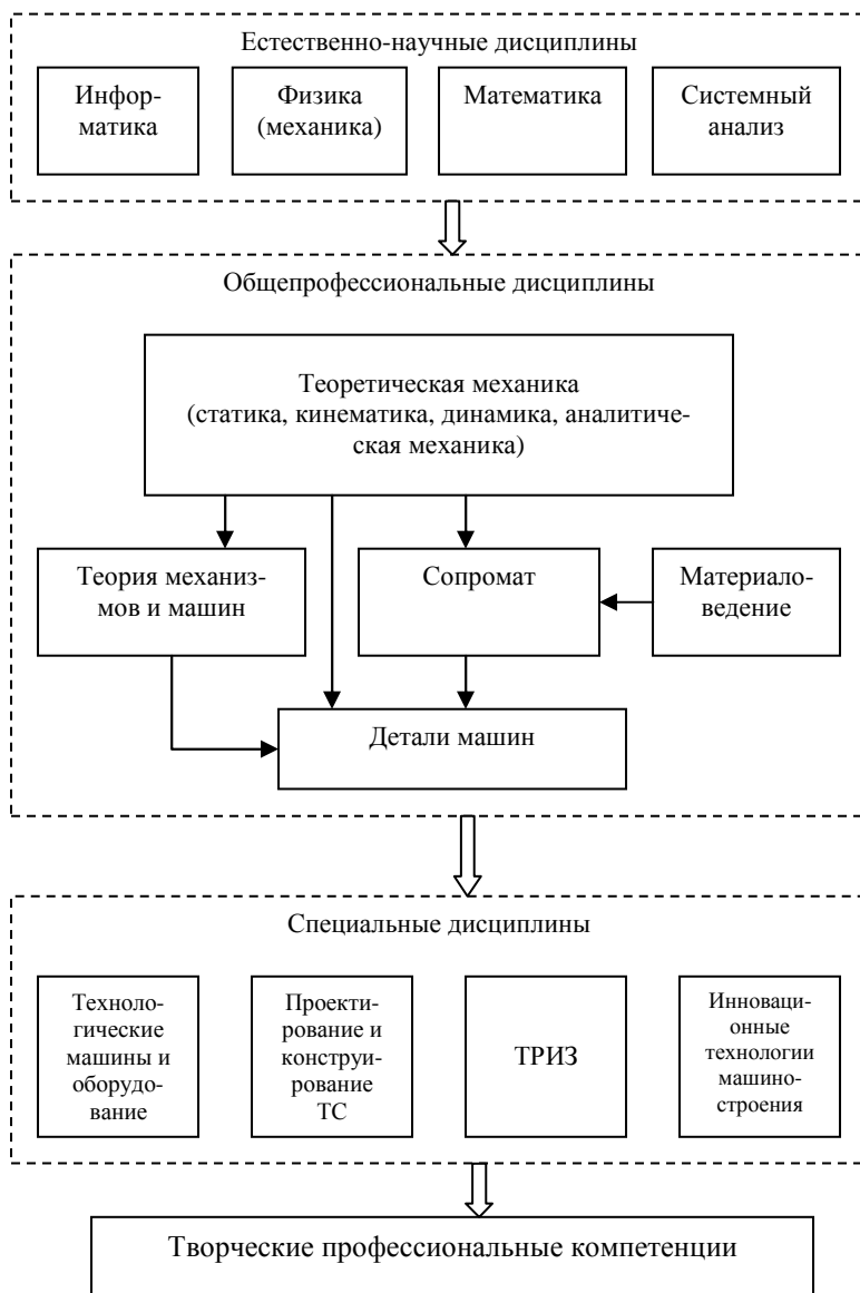
Рис. 3. Схема взаимодействия теоретической механики с дисциплинами других циклов при подготовке бакалавра