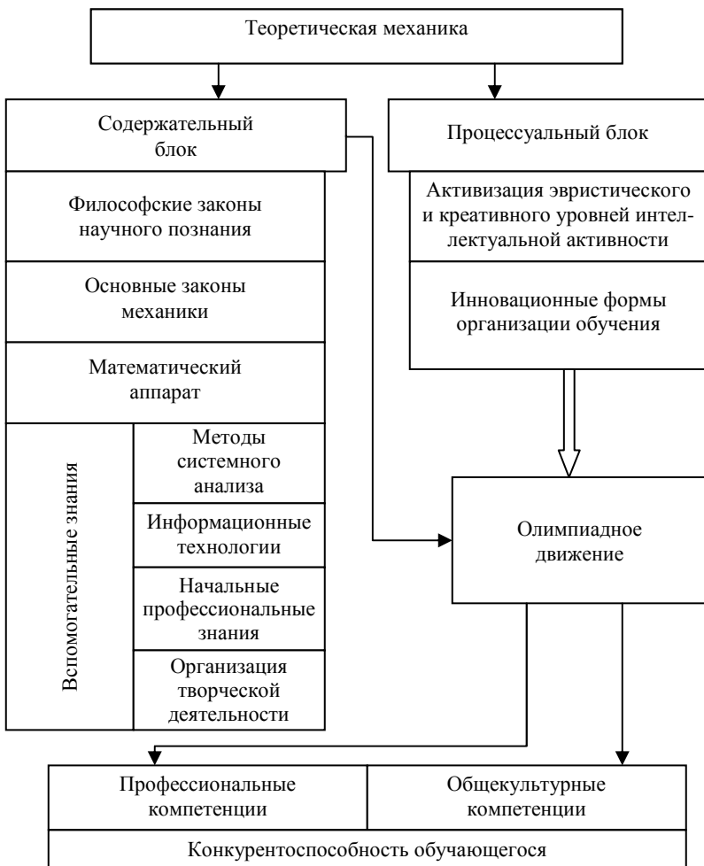
Рис. 4. Модель включения учебной дисциплины «Теоретическая механика» в олимпиадное движение

Работа в команде в олимпиадных микрогруппах, во время командных конкурсов на олимпиаде позволяет выработать у студентов навыки как организации своей деятельности в рамках коллектива, так и организации работы всего коллектива, лидерские качества.