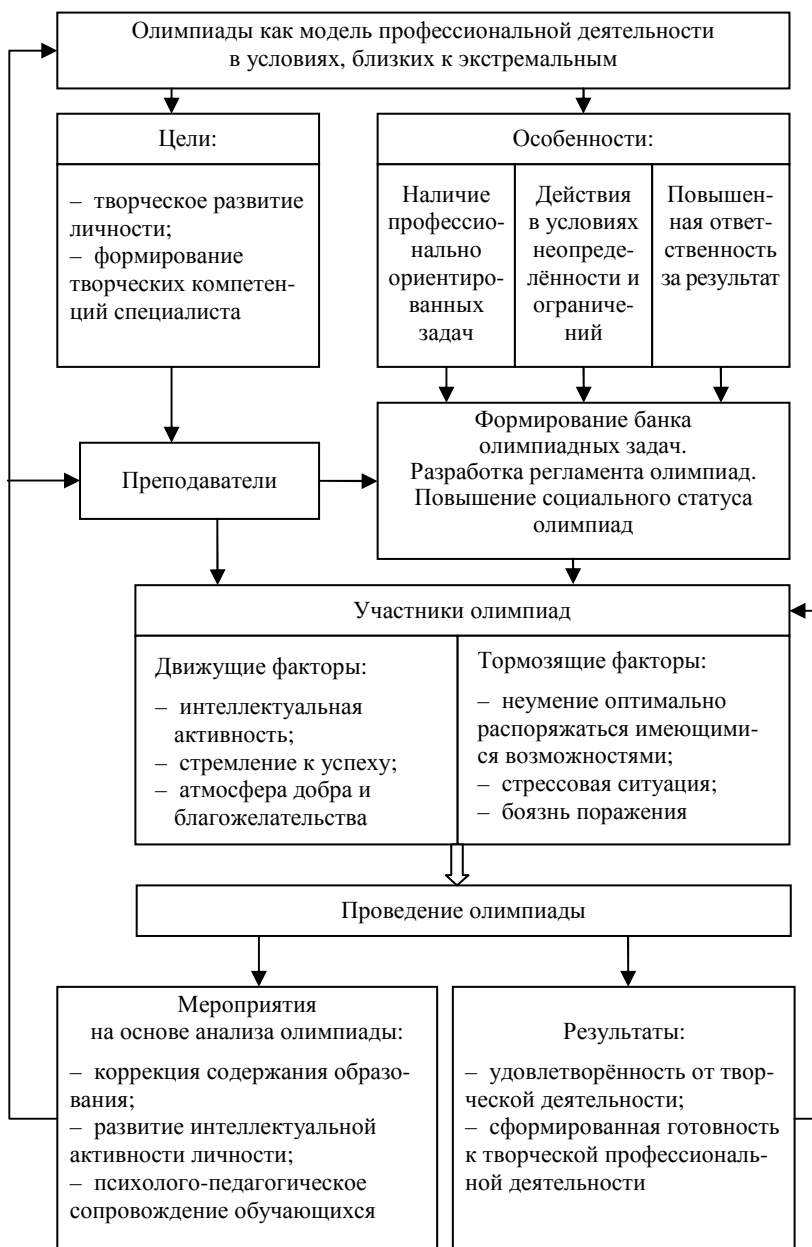
Рис. 1. Схема функционирования олимпиады