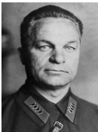
Маршал Советского Союза. Начальник Генерального штаба, заместитель наркома обороны СССР.