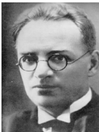
Известный российский писатель. Автор романов и повестей: "Голый год", "Красное дело", "Повесть непогашенной луны", "Волга впадает в Каспийское море". Расстрелян в 1937 году.