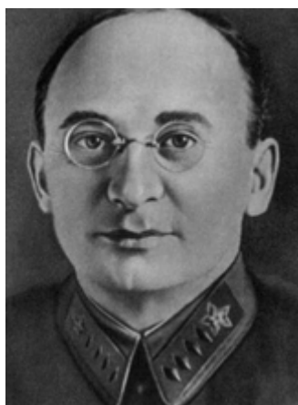
Нарком НКВД СССР. Сменил на этом посту Н.И. Ежова.